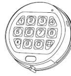
3750-K Runde EEH