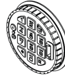
3125 Runde EEH