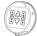
3190 Privat II (optional)

Das ComboGard Pro Schloss hat drei Betriebszustände: